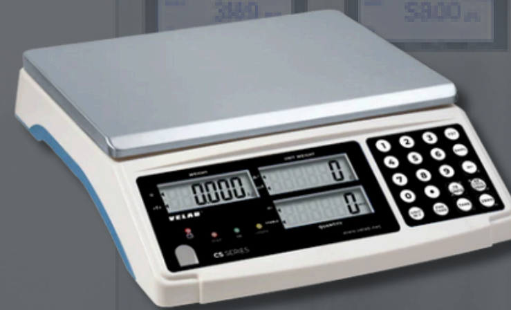
MVE-CS6S Legibilidad 0.2 g / 0.0005 lb