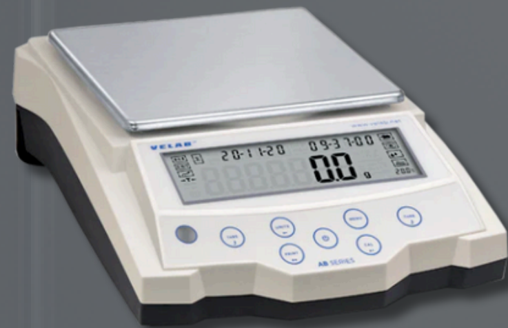
MVE-6201 Legibilidad 0.1 g