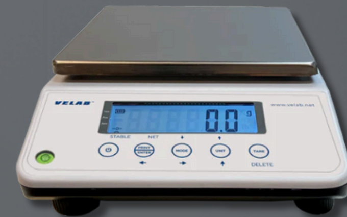
MVE-LCB6 Legibilidad: 0.1 g / 0.0002 lb